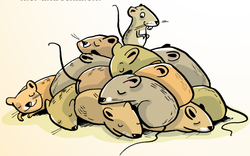
Illustration: Liliane Oser

Wie viele Mäuse liegen hier und schlafen?