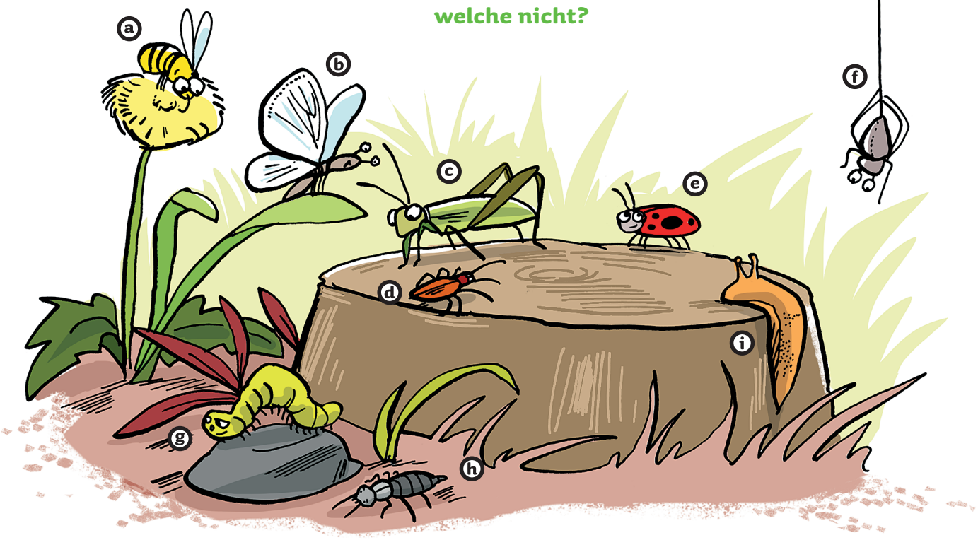
Illustration: Liliane Oser

Welche Wiesenbewohner können fliegen, welche nicht?